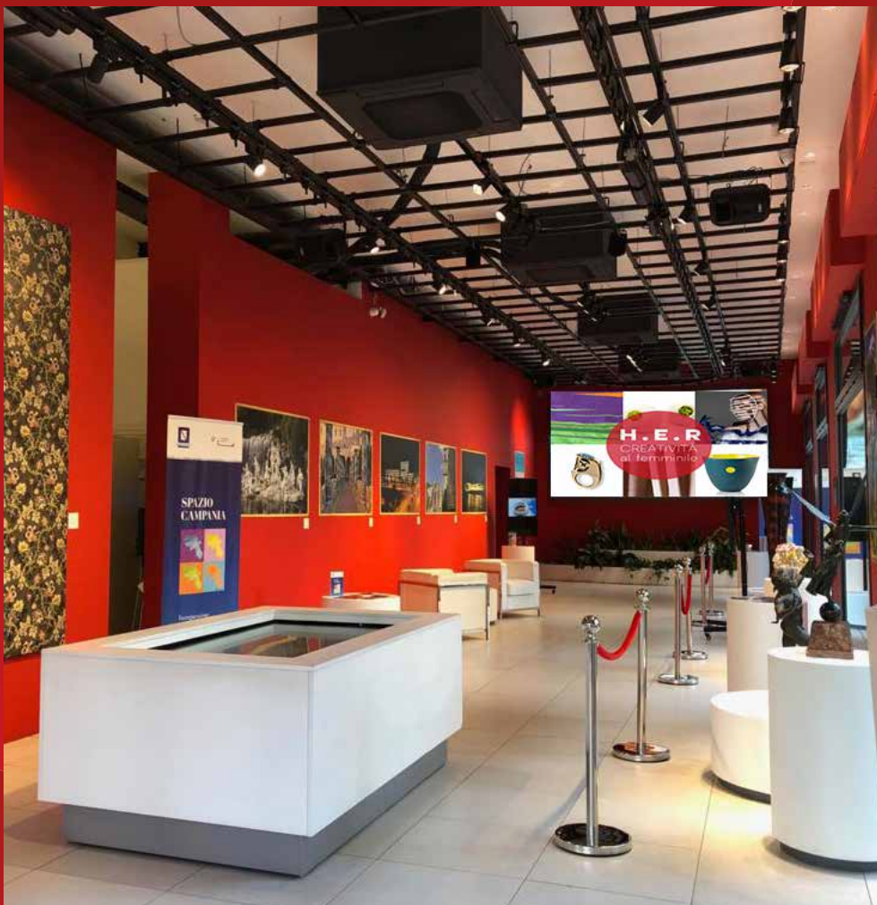
Spazio Campania - Piano terra