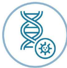
RICERCA DIRETTA DELL'RNA VIRALE (RT-PCR)

Test di riferimento per la diagnosi di Covid-19 eseguito nei laboratori autorizzati dal Ministero della Salute.