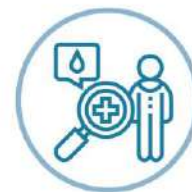
PRELIEVO DI SANGUE